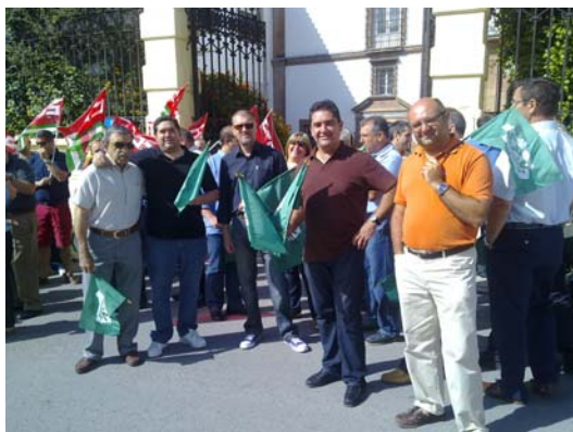
GRUPO DE COMPAÑEROS A LAS PUERTAS DE LAS ANTIGUAS BODEGAS DOMEQ

La concentración llevada a cabo ayer es la primera de las que se realizarán hasta que la firma deje estas prácticas "ilegales".