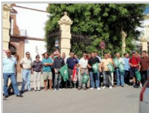
▼ Un momento de la concentración ayer de los vigilantes de seguridad frente a Beam Global.

Diversas empresas usan porteros para funciones que sólo pueden hacer los vigilantes jurados